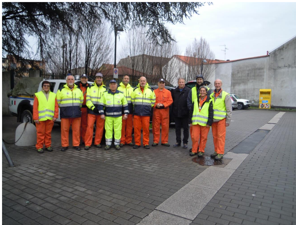
Gruppo comunale - foto di gruppo