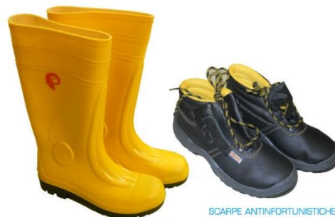
STIVALI PVC ANTINFORTUNISTICI SAFETY PVC BOOTS